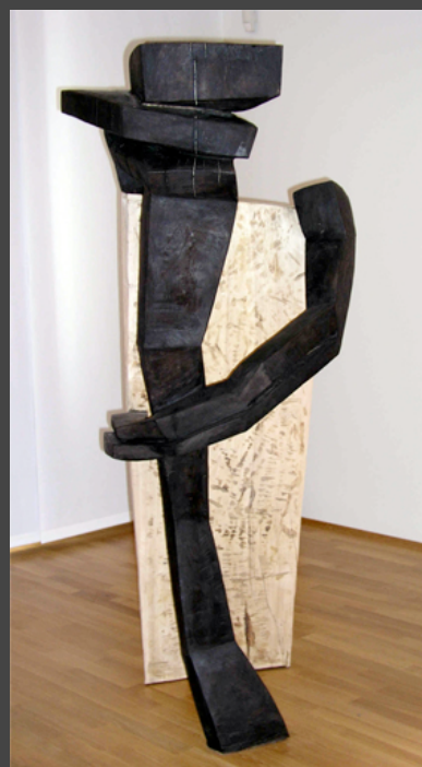
Beate Debus: Schritthalten

Ausstellung: Die Holz-Skulpturen, Zeichnungen, Collagen und Druckgrafiken der Thüringer Bildhauerin Beate Debus (geb. 1957) aus Oberalba/Rhön gehören hinsichtlich ästhetischer Qualität und sozial bedeutsamem Inhalte zu den ausgereiftesten in Thüringen und in der Rhön. Die vielgestaltige Exposition verführt über reizvolle Oberflächenstrukturen sowie kontrastierende Farbnuancen und Bewegungen die Sinne und lässt Räume sowie Körper spielerisch erkunden. Der Besucher begegnet dem Wesen der klassischen Skulptur und darf dem in Bildformeln festgehaltenen Lebensgefühl einer Künstlerin nachspüren.